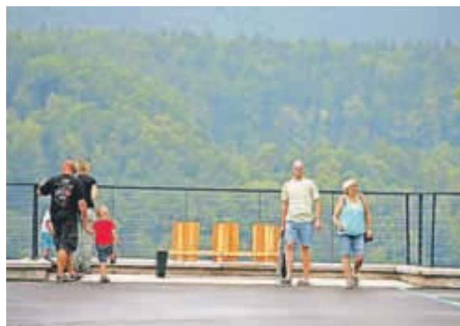
Na razgledni ploščadi se odpira pogled na Savo in Jelovico.