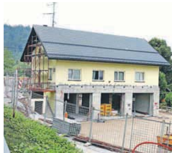
Rekonstrukcija stavbe Gasilskega doma v Podnartu teče po načrtih.

Spomladi so v Podnartu začeli obnavljati stavbo Gasilskega doma. Veliko prostovoljnega dela, podpora krajanov.