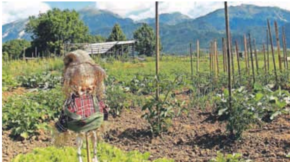
Preden sem sploh lahko začela vrtnariti, je bilo treba zemljo dobro očistiti kamenja in travne ruše.

Rečeno, storjeno. Na občino sem se šla pozanimat, ali je na voljo še kakšen vrtniček. Bilo jih je še toliko, da sem lahko izbirala. Pa sem si rekla, zakaj ne bi vzela kar dveh, saj 200 kvadratov ne more biti prav veliko. Potem sem zavila v trgovino z vrtnarskimi pripomočki, kupila slamnika, gumijaste škornje, samokolnico in nekaj