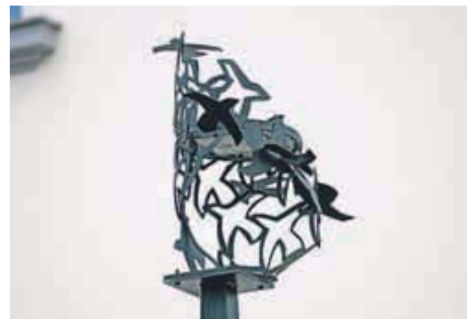
Na vsaki svetilki je tudi ime avtorja. Svetilka na fotografiji je nastala po predlogi Črta Freliha iz Radomelj.