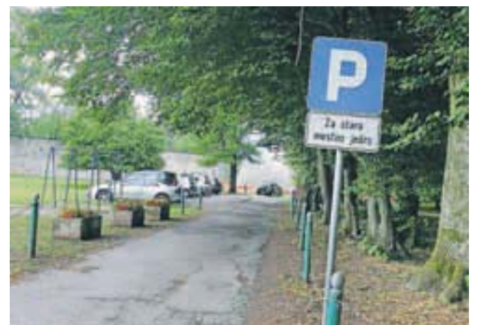
Staro parkirišče v grajskem parku bodo zaprli še pred koncem leta.