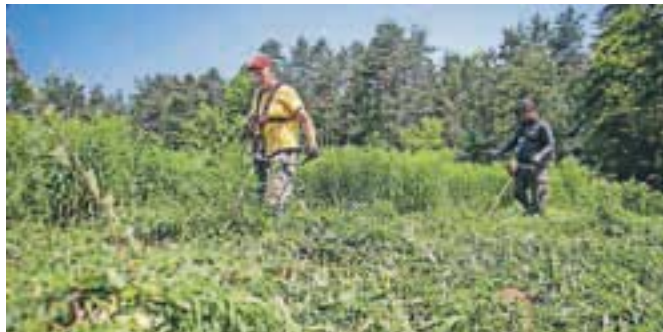
Letos so se akciji odstranjevanja invazivnih tujerodnih rastlin pridružili tudi delavci Kampa Šobec.

Kot poudarjajo na zavodu za varstvo narave, imajo invazivne tujerodne vrste veliko negativnih vplivov tako na gospodarstvo in zdravje ljudi kot na biotsko pestrost in krajinsko podobo naših krajev. Na območju občin Radovljica in Bled sta predvsem problematični dve tujerodni vrsti zlate rozge, kanadska in orjaška zlata rozga, ki se širita po travnikih, ob gozdnih robovih in mokriščih. Postopoma odvzemata življenjski prostor domorodnim vrstam, kot so različne travniške cvetlice, kukavičevke ali orhideje in rastline, vezane na barja in močvirja. Akcija je del projekta projekta Amc Promo BID, podprli pa sta jo tako občina Radovljica kot tudi občina Bled.