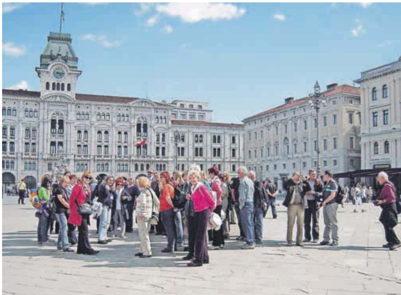
Na Velikem trgu