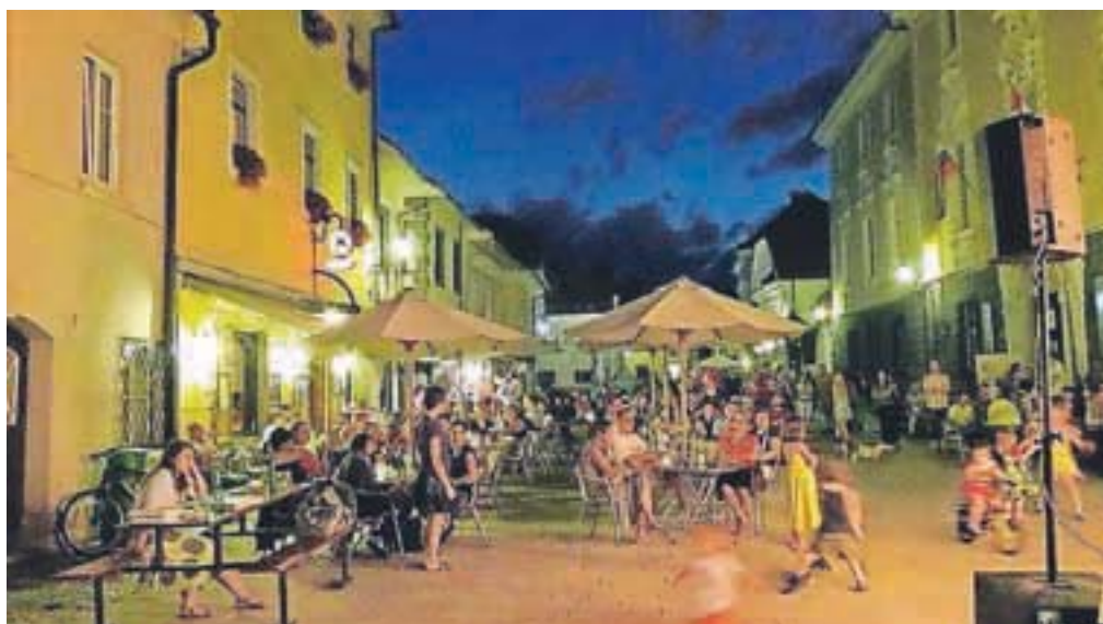
"Večerno vzdušje", avtor Ljubo Kozic (diploma)