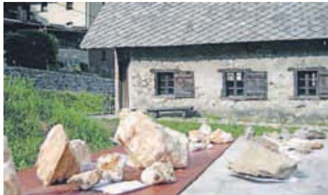
... in pred vigenjcem Vice.