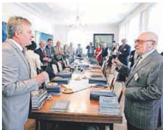
Radovljica je v začetku junija gostila upravo Mednarodnega združenja Chopinovih društev, ki se je v prostorih občine sestala na svojem letnem srečanju, ki ga je organizirala radovljiška ustanova Chopinov zlati prstan.