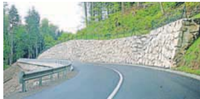
V začetku meseca je spet stekel promet po prenovljenem odseku regionalne ceste na Lancovem.