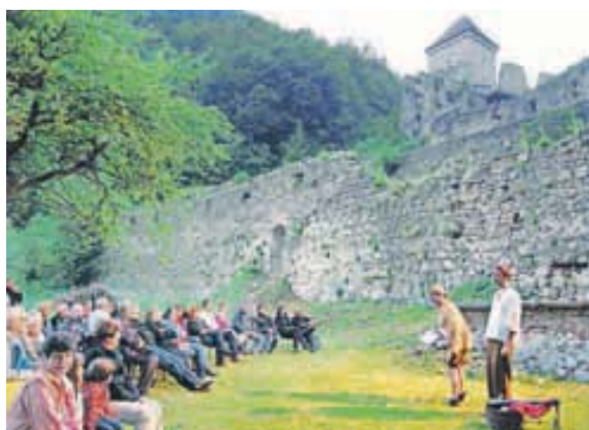
Naravna kulisa gradu je bila odlično prizorišče za obuditev legende o Erazmu Predjamskem.

Naravna kulisa gradu je bila odlično prizorišče za obuditev legende o Erazmu Predjamskem. Igralcema Teatra Cizamo so pri šaljivi uprizoritvi zgodbe o Erazmu pomagali tudi naključni gledalci, ki so se takoj vživeli v vloge in jih odlično odigrali. Za zaključek pa je občinstvo, ki je uživalo v pestrem dogajanju ob kresni noči, ponovno navdušila skupina Čupakabra, ki je v soju ognja razsvetlila grad. Kres je zagorel in nekoliko podaljšal svetlobo noči, ki se spet daljša in čaka, da se vrne ob letu osorej.