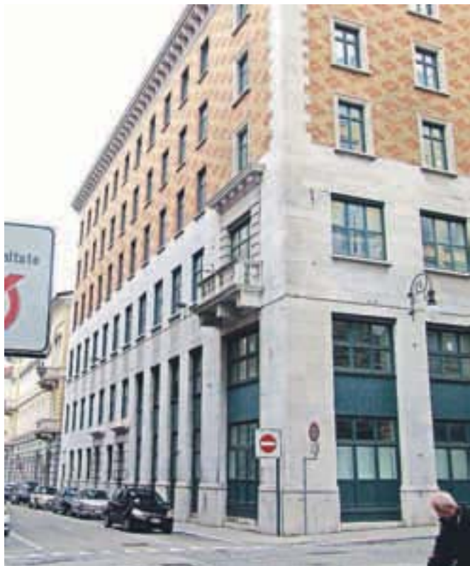
Narodni dom, požgan leta 1920