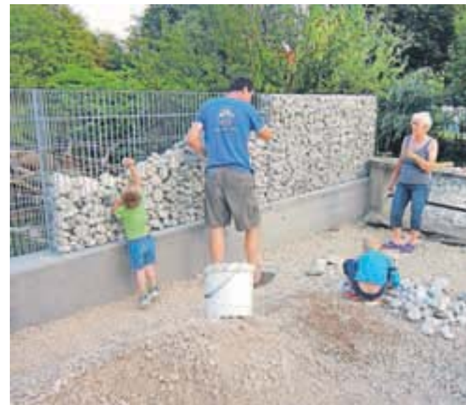
Veliko dela opravijo gasilci sami – tako so pred kratkim v delovni akciji uredili kamnito ograjo.