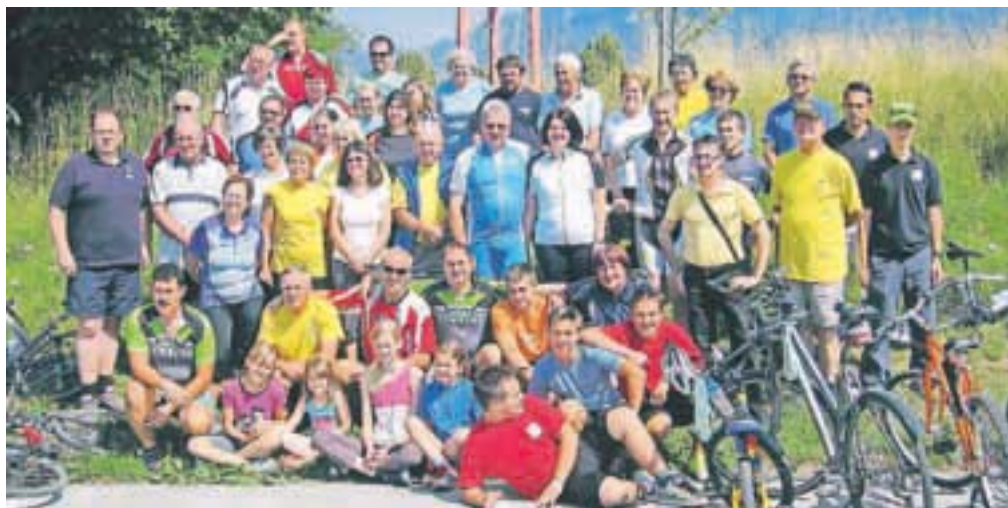
Udeleženci 13. Leškega kolesarskega kroga

Na praznik krajevne skupnosti Lesce so svoj kamenček k praznovanju dodali tudi kolesarji. Lani so bile izredno slabe vremenske razmere, a kljub vsemu so se na leškem kolesarskem krogu zbrali trije najbolj vztrajni in poskrbeli, da se tradicija vsakoletnega kolesarjenja ni prekinila. Letošnja prireditev niti malo ni bila vprašljiva, saj je sončno jutro privabilo na plan še tiste zadnje skeptike, ki so kolebali na kolo da ali ne. Osmo ura je pomenila zbor za tiste, ki so si upali malce več, za pot, dolgo 35 km, ki je vodila na relaciji od Lesc, Radovljice, čez Lancovo, Lipnico, Podnart, Zaloše, Otoče, Posavec, Brezje, Spodnji Otok, Zapuže, Hlebce, Studenčice, Hraše, nazaj do Lesc. Daljše poti se je udeležilo 38 kolesarjev. Še večja udeležba je bila na