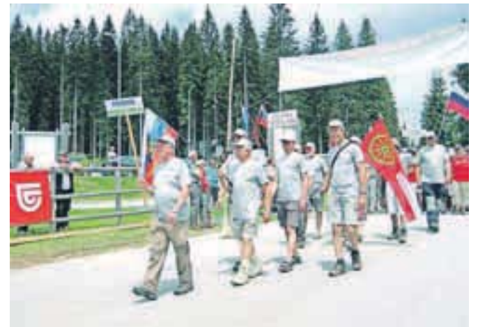
Med pohodniki so bili tradicionalno tudi Radovljičani.