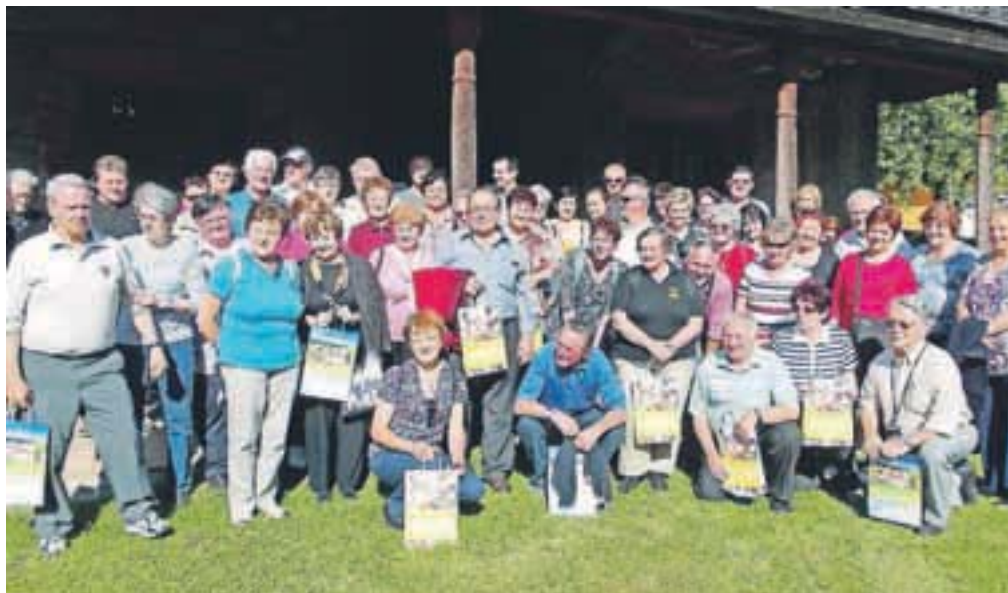
V turističnem društvu Begunje vsako leto pripravijo izlet za člane in krajanje po domačih in tujih krajih. Tokratna pot jih je vodila v zanimiv in zgodovinsko povezan kraj Bad Vigau, vasico, ki leži ob vznožju visokih solnograških gora.