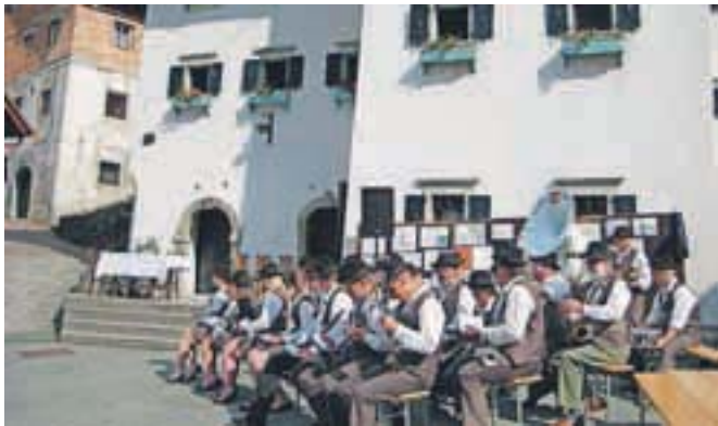
Živahno dogajanje na Placu ...