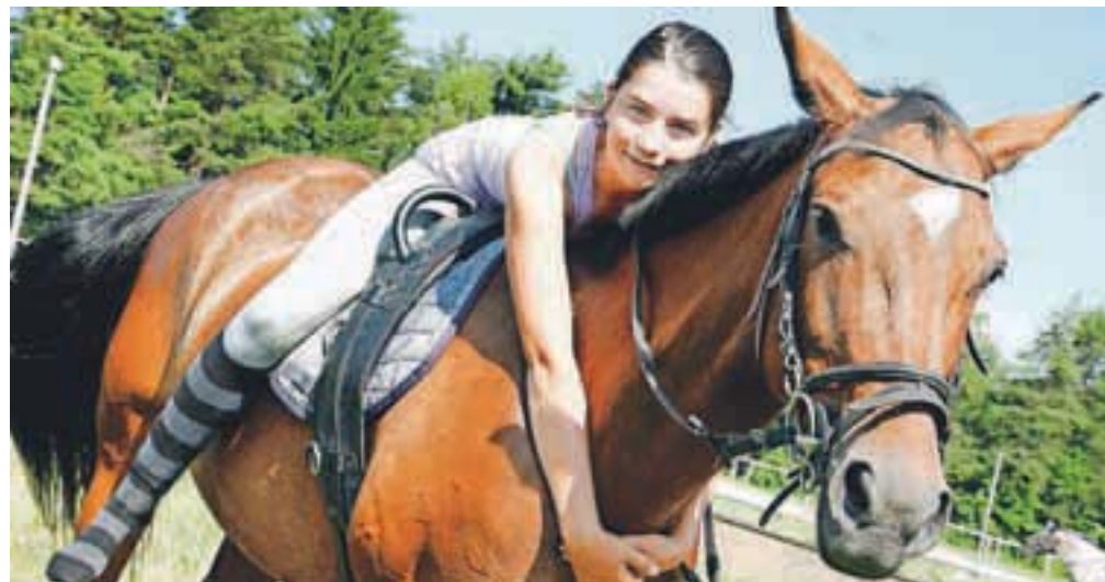
Najvažnejša razsežnost terapevtskega jahanja je pomemben stik dveh teles.

Kot pravi Ipavčeva, so zato tudi na Gorenjskem želeli oblikovati program za aktivnosti in terapije s pomočjo konj, ki bi povezoval strokovnjake in terapevte za ranljive ciljne skupine. »Skozi program povezane terapevte bomo približali