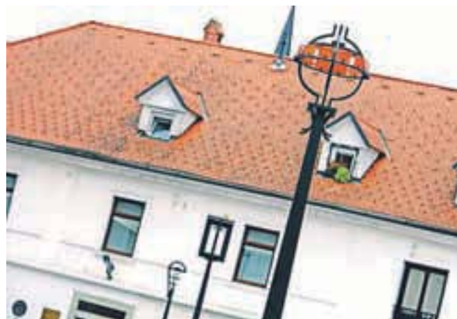
Svetilke na parkirišču so delo domačih umetnikov in kovačev iz Kroke.