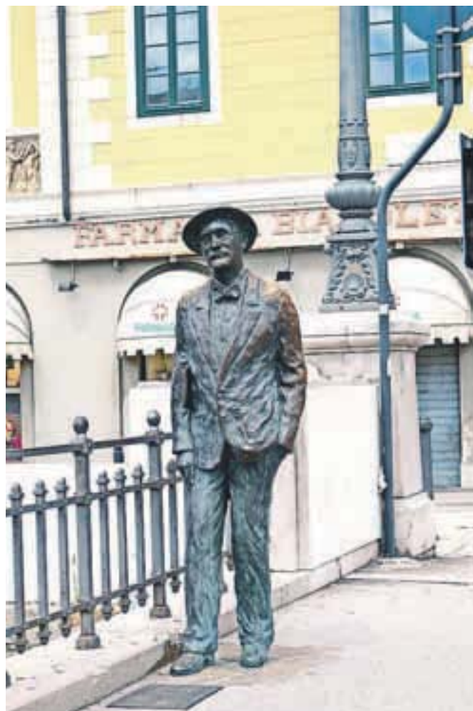
James Joyce na Rusem mostu